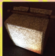
写真はイメージです。柄ではありません。